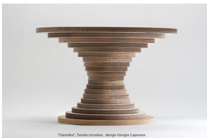
"Cresciva", Tavolo circolare, design Giorgio Caporaso