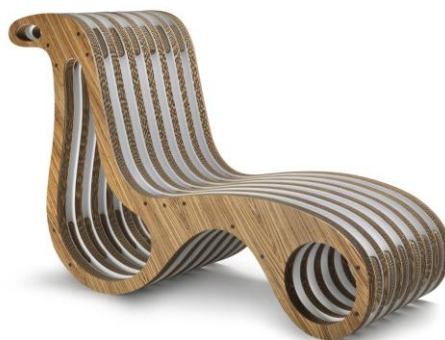
"XChair", chaise longue e poltrona, design Giorgio Caporaso