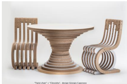
"Twist chair" + "Cresciva", design Giorgio Caporaso