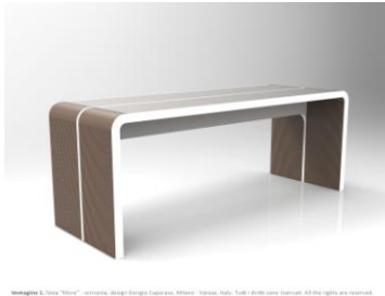
immagine L. linea "More_Light" scrivania, design Giorgio Caporaso. Milano - Venezia - Italia

"Giorgio Caporaso Ecodesign Collection" by Lessmore – www.lessmore.it