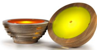
"Tappi", tavole, lampade, contenitori, design Giorgio Caporaso