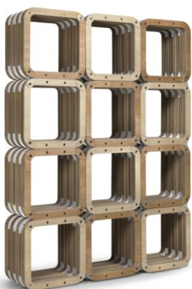
"More_Light", sistema di librerie, espositori, contenitori, design Giorgio Caporaso